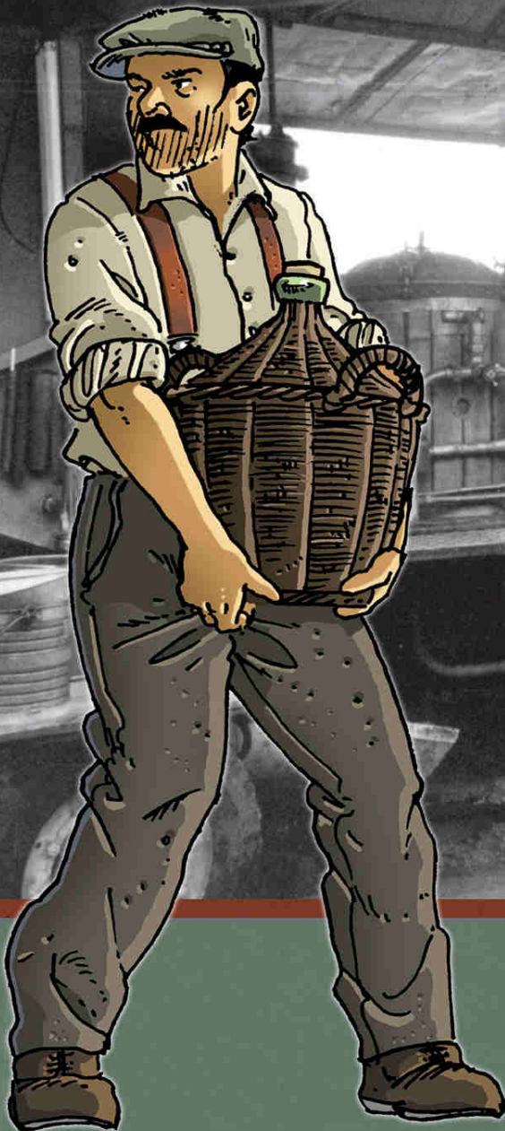
Illustration : Distillation à Saint-Jacques-en-Faucigny